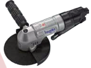
HY - 5LS