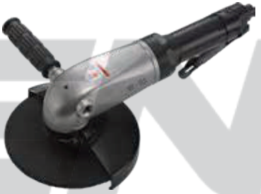
HY - 7LS