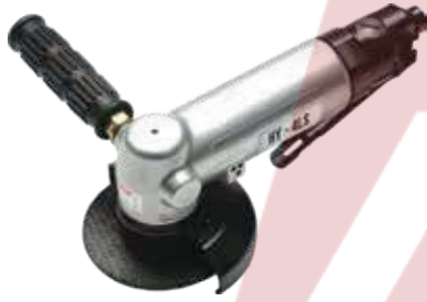
HY - 4LS