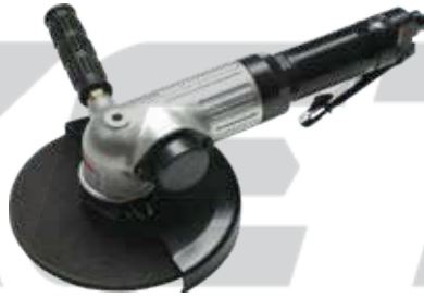
HY - 7LD