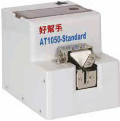
AT - 1050