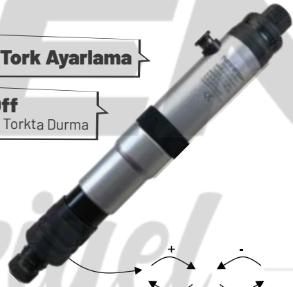
PRO - 3000 SERİSİ